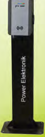
BUSINESS MODEL AC ARAÇ ŞARJ CİHAZLARI BUSINESS MODEL AC EV CHARGER