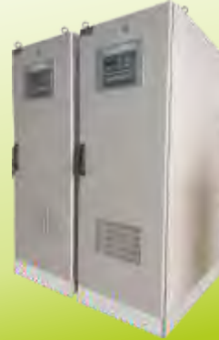
STATİK TRANSFER ANAHTARI STATIC TRANSFER SWITCH 50-3000 A