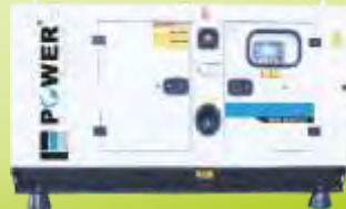
JENERATÖR GENERATOR 1-3000 kVA