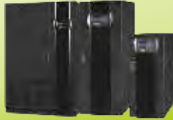
GOLD DS33 SERİSİ UPS GOLD DS33 SERIES UPS 3 LEVEL 10-400 kVA