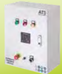
OTOMATİK TRANSFER ANAHTARI ATS AUTOMATIC TRANSFER SWITCH