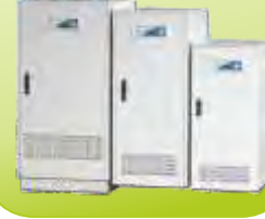
ENDÜSTRİYEL UPS INDUSTRIAL UPS 10-80 kVA