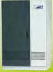
ENDÜSTRİYEL UPS INDUSTRIAL UPS 100-300 kVA