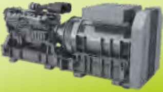
D SERİSİ DİNAMİK UPS D SERIES DYNAMIC UPS 100-2500 kVA x10= 25 MVA