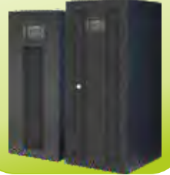
EUROPA MBR SERİSİ UPS EUROPA MBR SERIES UPS 10-120 kVA