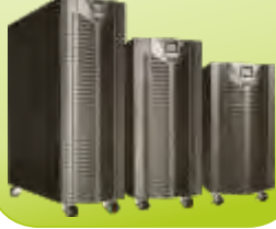
OL SERİSİ UPS OL SERIES UPS 10-100 kVA