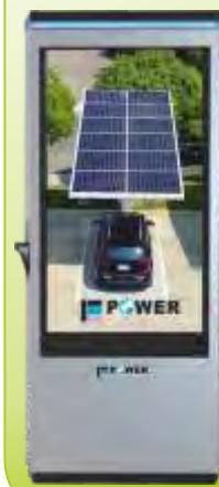
DC HIZLI ARAÇ ŞARJ CİHAZLARI DC FAST EV CHARGER