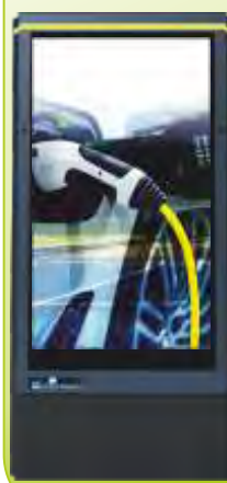
GENİŞ EKРАН DC ARAÇ ŞARJ CİHAZLARI DC EV CHARGERS with ADVERTISEMENT DISPLAY