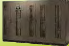
EUROPA MBRH SERİSİ UPS EUROPA MBRH SERIES UPS 100-800 kVA