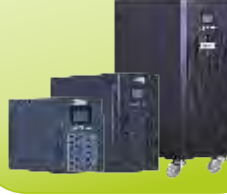
OL SERİSİ UPS OL SERIES UPS 10-20 kVA 1-10 kVA