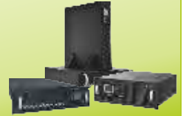
RM SERİSİ, RACK MOUNT UPS RM SERIES, RACK MOUNT UPS 1-10 kVA