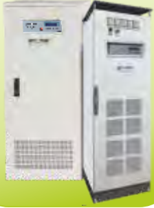
ENDÜSTRİYEL UPS INDUSTRIAL UPS 6-30 kVA